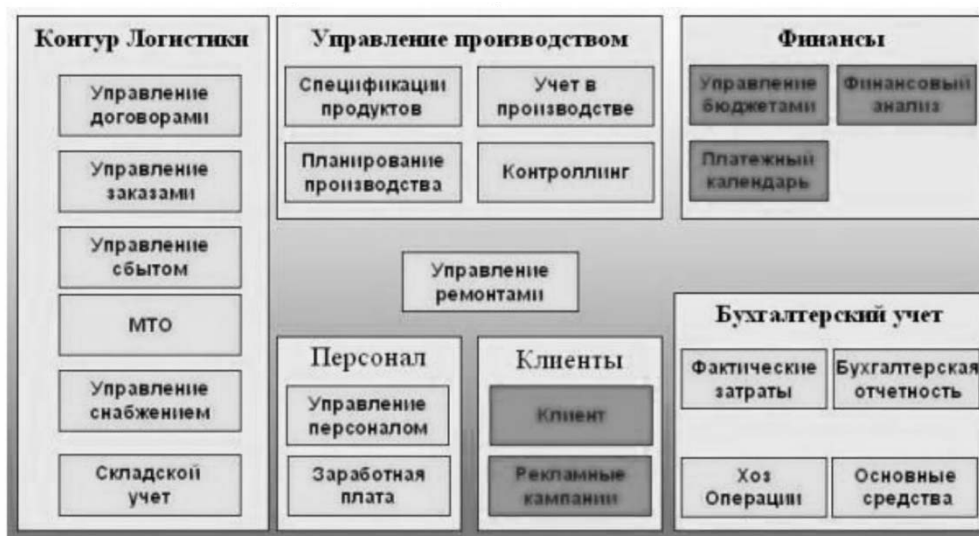
Рис. 2. Интерфейс системы Галактика

Система "Галактика" отечественного производства обладает дружелюбным для пользователя интерфейсом, содержит большое количество модулей, объединенных в контуры, которые поддерживают большинство требуемых функций, как для малых и средних, так и крупных предприятия, а также обладает достаточно высоким уровнем защиты информации. Имеет разновидности ERP и BI. Благодаря российскому происхождению, на территории РФ находятся представительства данной компании, которые могут оказать поддержку на этапе внедрения и эксплуатации системы. Пример интерфейса данной системы представлен на рис.2.