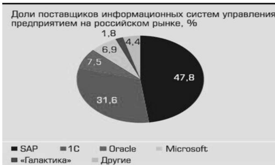
Рис. 1. Доли поставщиков информационных систем управления на российском рынке, %

Безусловно, каждая из систем имеет свои ключевые достоинства и недостатки. Рассмотрим их более подробно.